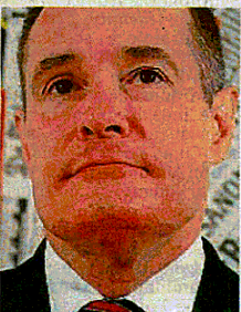
AI VERTICI Fabrice Leggeri

tex. In un'intervista rilasciata a Voice of America ci intima di «stare pronti». A cosa? Ma, ovviamente, al fatto che «l'ISIS vuole armare i richiedenti asilo, potrebbe farne un'arma contro l'Europa». Secondo Leggeri, «molte persone potrebbero venire radicalizzate o manipolate, utilizzate dai gruppi terroristi dopo il loro ingresso in Europa». Già nell'aprile di quest'anno, del resto, era stata sempre Frontex a scrivere in un rapporto: «Gli attacchi di Parigi nel novembre 2015 hanno chiara-